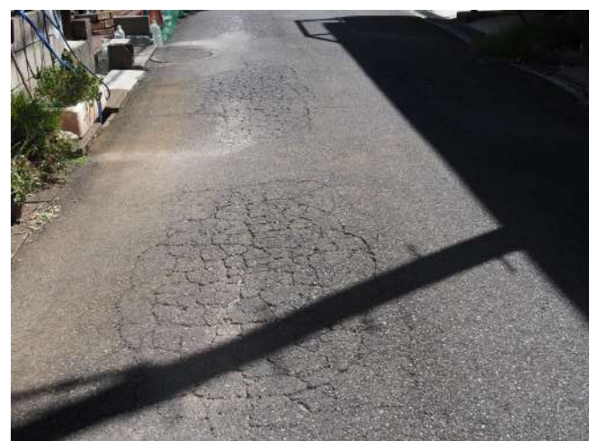
10 広範囲に渡って道路陥没