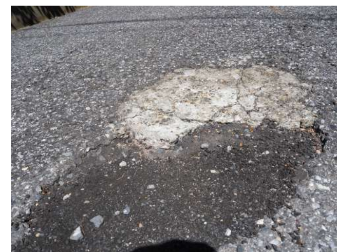
8 補修箇所の再破損