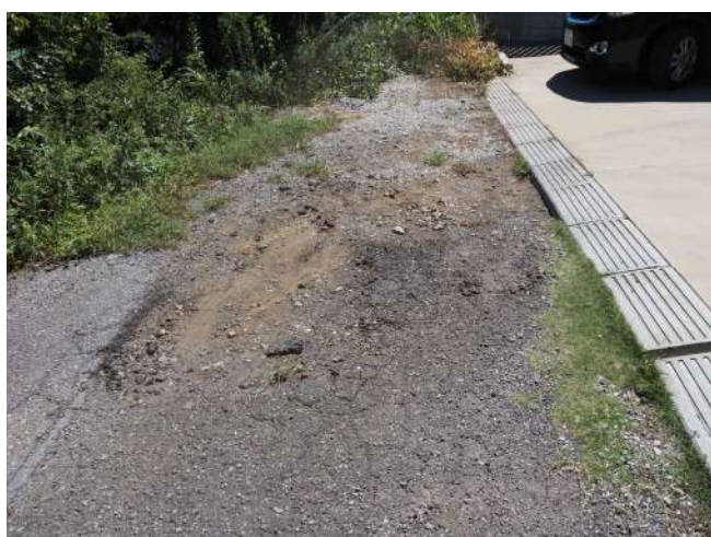
5 未舗装道路(行き止まり)