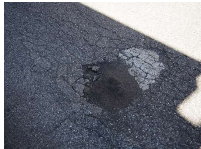
2 補修箇所の再破損